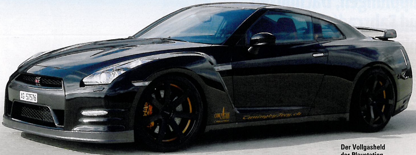
Der Vollgasheld der Playstation-Generation.