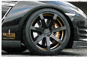
Spezielle schwarz-bronze Farbkombination.

■ Godzilla genießt in der japanischen Kultur einen besonderen Stellenwert. Das Urzeitmonster symbolisiert für das Land der aufgehenden Sonne gleichermassen Grösse, Kraft und Unbesiegbarkeit. So ist es für den Nissan GT-R auch eine besondere Ehre, nach dem nationalen Mythos benannt zu werden. Schliesslich besticht auch das Topmodell der Marke durch seine imposanten Abmessungen, seine Motorpower und die Fabelwerte, mit denen er seit bald vier Jahren die mehr als doppelt so teure Sportwagenelite von Porsche oder Ferrari abkocht. Trotzdem nicht genug, um den Hunger der Garage Frey aus Unterentfelden zu stillen. Sie verschafft dem 530 PS starken und 315 km/h schnellen Nissan GT-R des Modelljahrs 2011 – übrigens noch bis nächste Woche am Autosalon Genf zu bestaunen – noch mehr Biss.