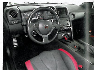
Japanisches Hightech im Interieur.

Akrapovic, deren sportlicher Klang beinahe von hier bis ins Land des Lächelns zu hören ist. Abgerundet wird das Tuning durch versilberte Blinkerbirnen und spezielle Bodenteppiche mit dem GT-R Logo. So geschärft, kann jeder «Godzilla»-Pilot auf der Rennstrecke japanische Freundlichkeit beweisen, wenn es heisst: «Sayonara Porsche, domo arigato Ferrari fürs Platz machen.» (ml)