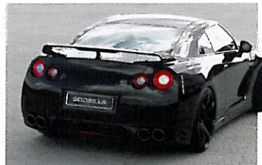
In seiner Preisklasse ohne natürliche Feinde.

Wer zum ersten Mal in freier Wildbahn dem japanischen Ungetüm gegenübersteht, traut dem 4,65 m langen, 1,89 m breiten und leer über 1800 kg schweren 2+2-Sitzer gar nicht zu, in 3,06 Sekunden von 0 auf 100 km/h zu sprinten. Oder dass der GT-R auf der Nordschleife mit einer Rundenzeit von 7:24 Minuten so prominente Namen wie Maserati MC12, Pagani Zonda F oder Ferrari Enzo hinter sich lässt. Doch «Godzilla» kann mehr als nur vorwärts stampfen. Und das zu ei-